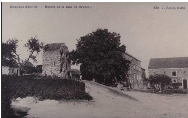
Ferme André Moës

Voici à quoi ressemblait la tour de Warzée qualifiée de maison du métayer par l'abbé Boniver: