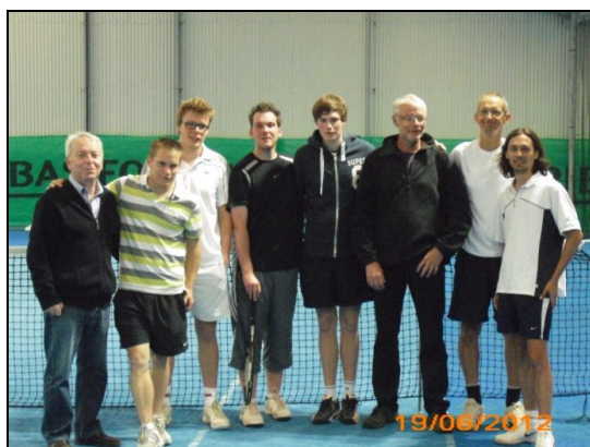
Photo prise à l'ASA, le jour de la finale des interséries.

Félicitations à notre équipe messieurs pour son parcours exceptionnel